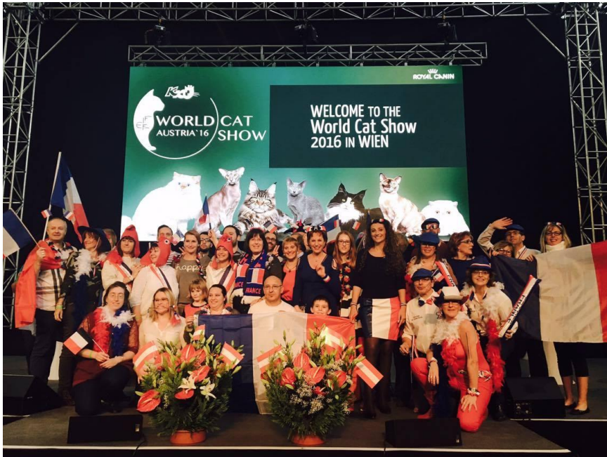
Le podium Français avec une belle représentative du Cat Club de Paris